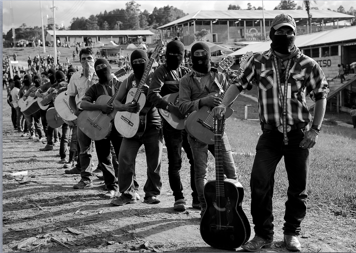
MODELO 1.