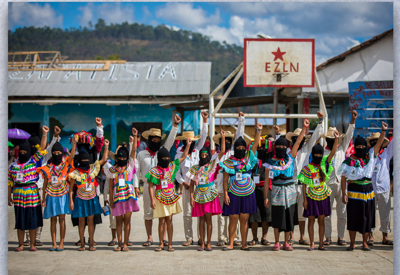
MODELO 6.