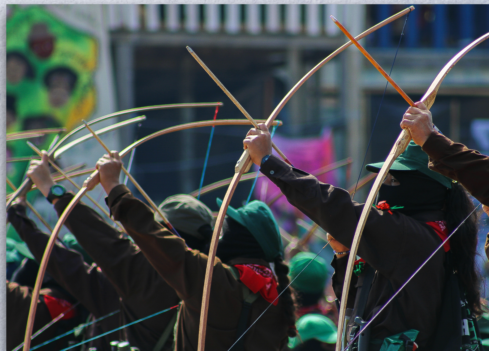
MODELO 9.