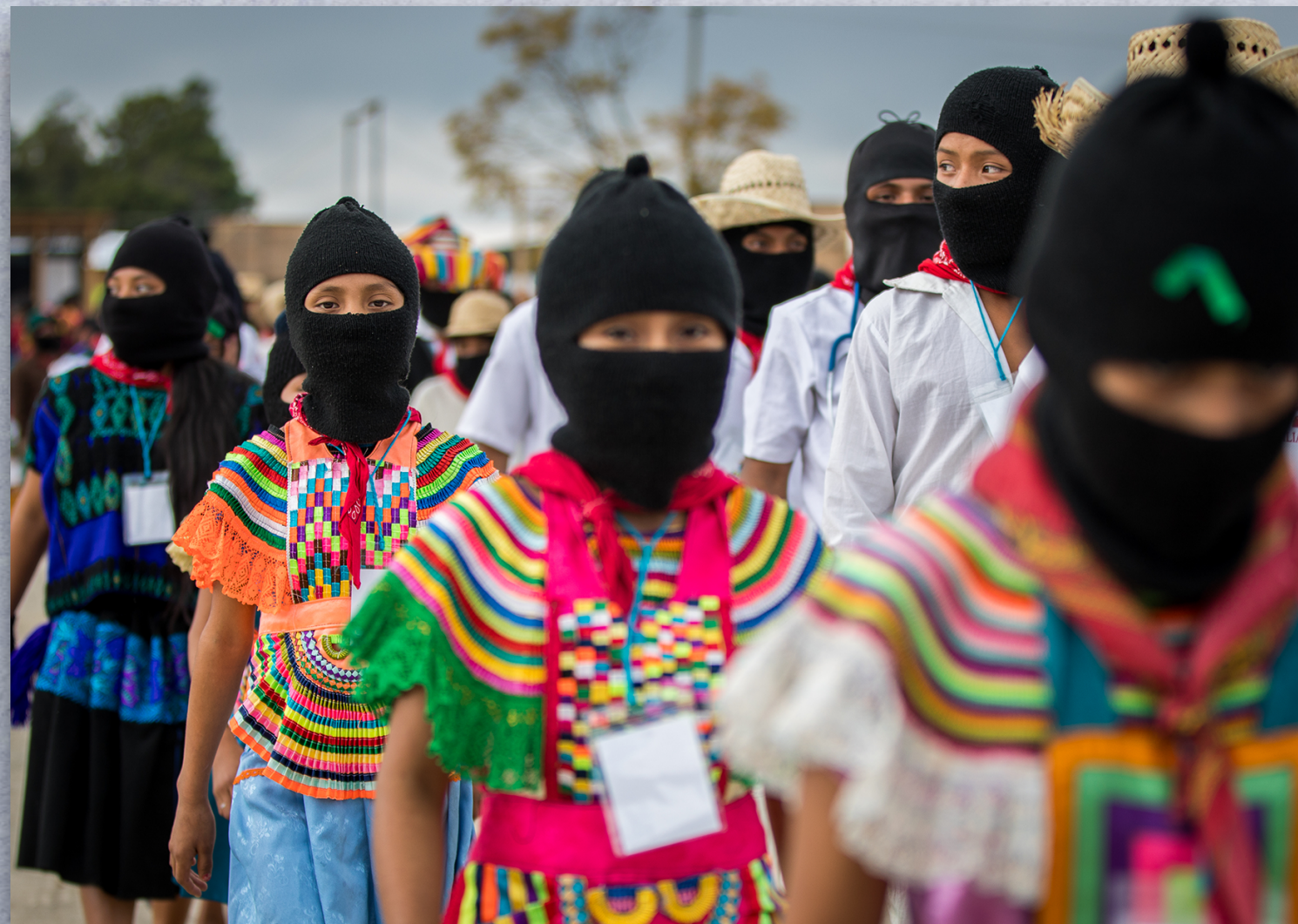
MODELO 4.