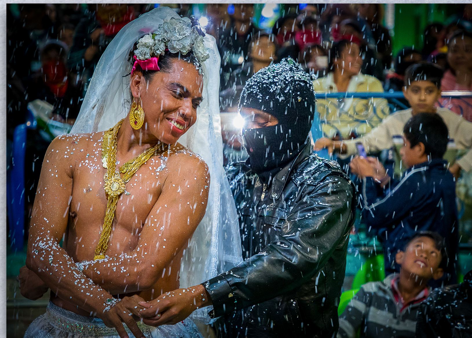
MODELO 8.