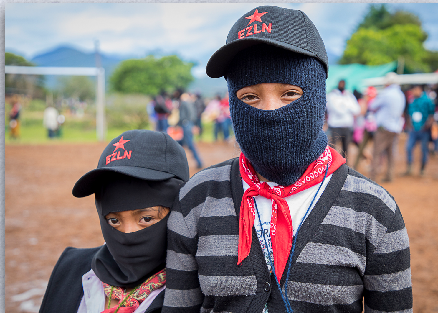
MODELO 5.