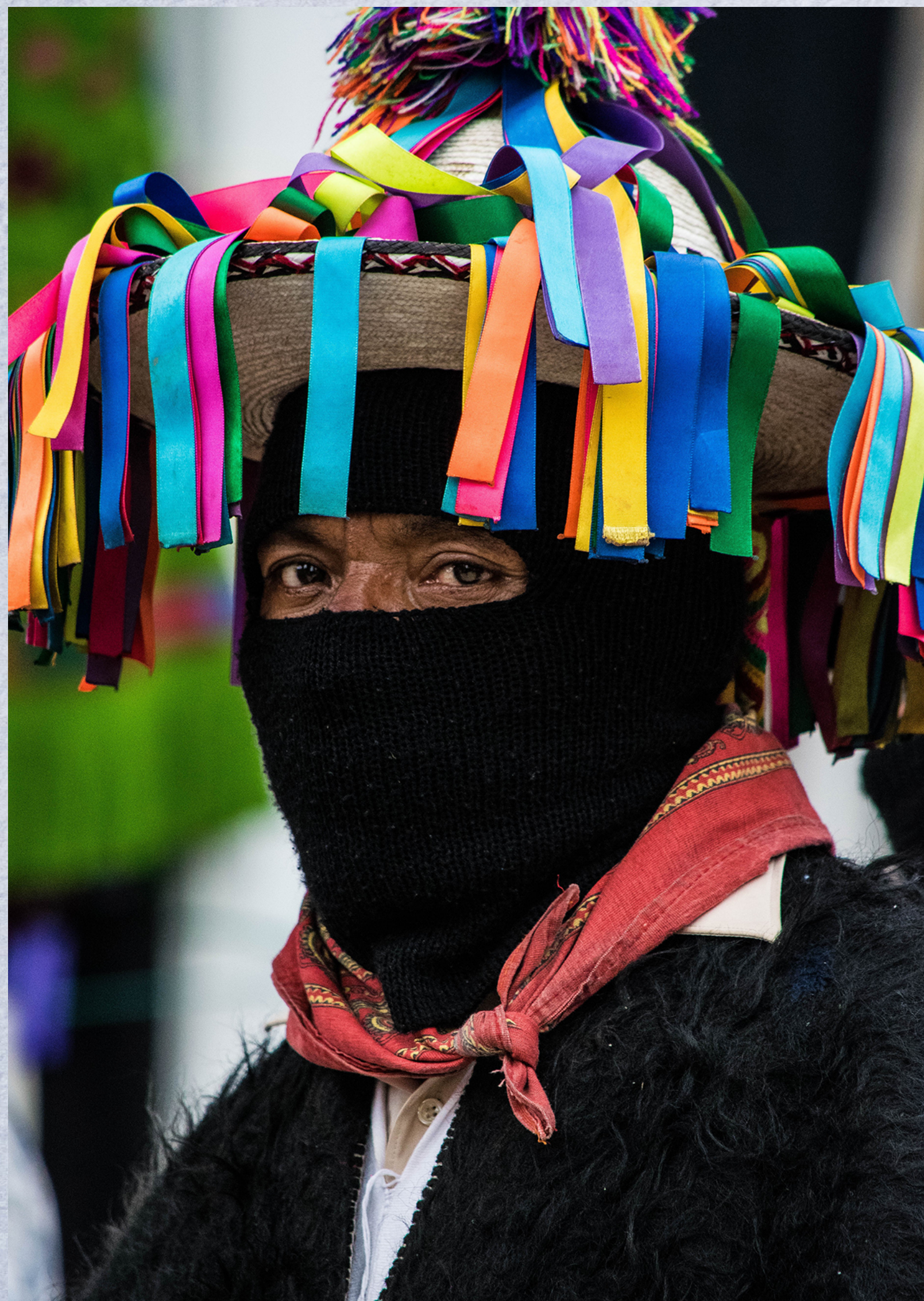
MODELO 7.