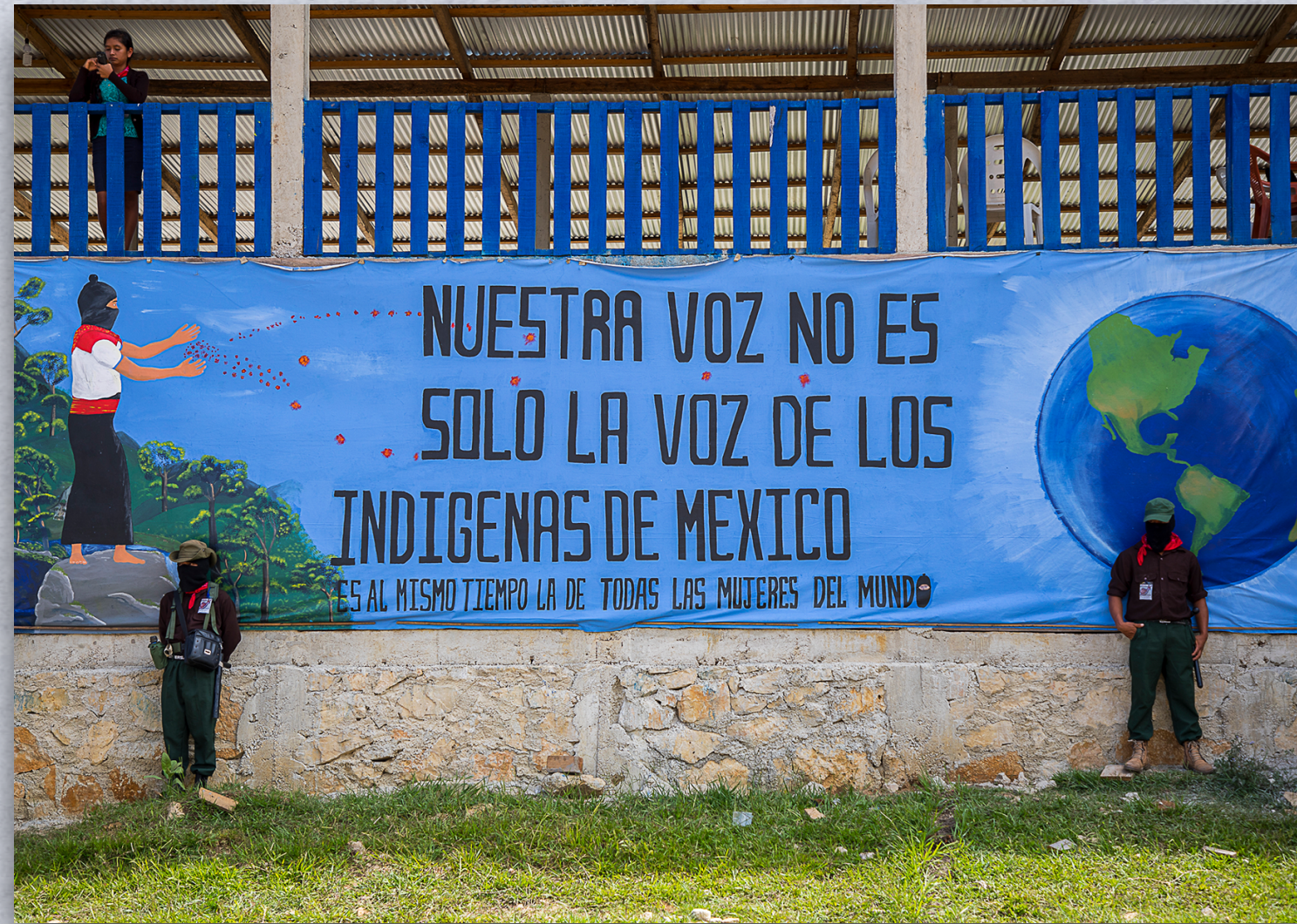
MODELO 2.