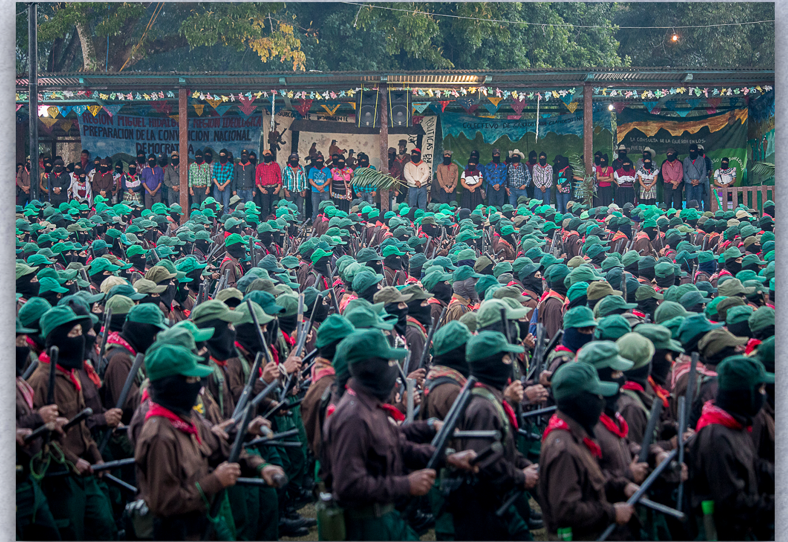
MODELO 3. Fotografía de Francisco Lion